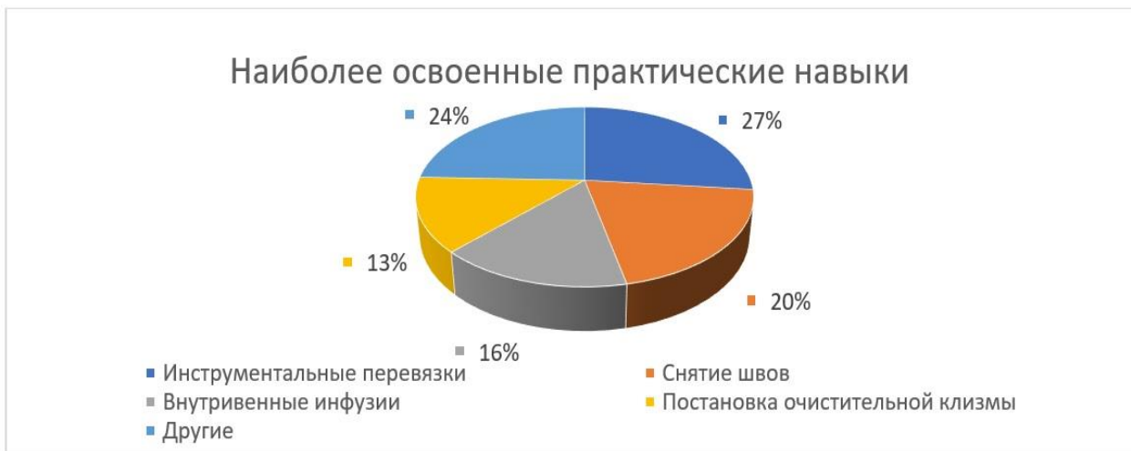
Рисунок 2 - Практические навыки наилучше освоенными студентами

Из данной диаграммы видно, что нет студентов, которые считают прошедший курс ПП неактуальным для себя, а 93% студентов из 201-о группы и 95,4% из 202-о (в среднем 93,3%) отметили прохождение ПП полезным для себя. 3 студента из обеих групп (6,7%) отметились как неопределившиеся и причина данного выбора была обоснована тем, что данные студенты работают младшими медицинскими сестрами в отделениях базы практики и уже были хорошо знакомы с особенностями работы в них.