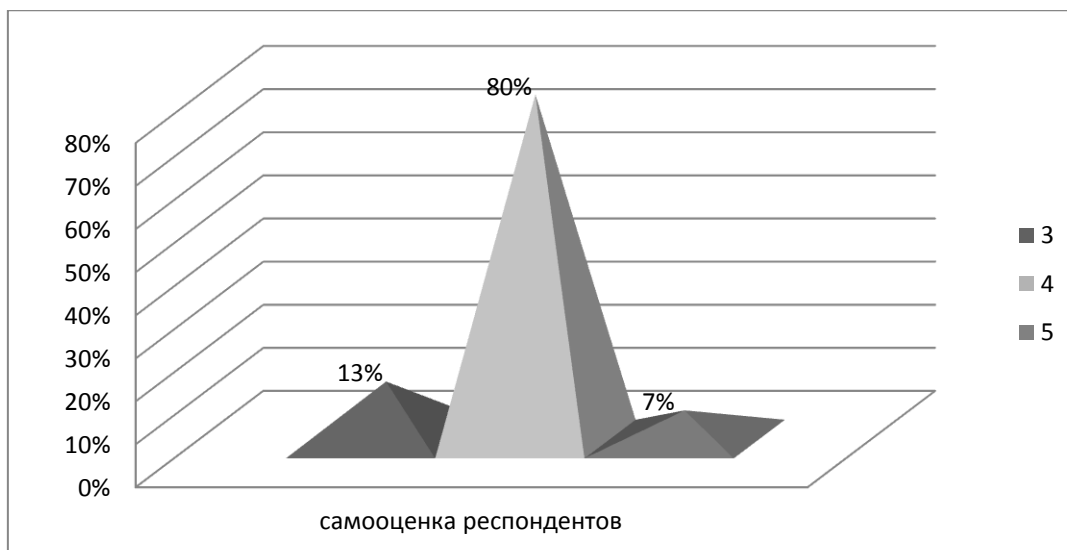
Рис.1. Самооценка респондентами готовности к участию в социально-педагогическом сопровождении.

Респонденты также оценивали, насколько они готовы на сегодняшний день к следующим видам деятельности: