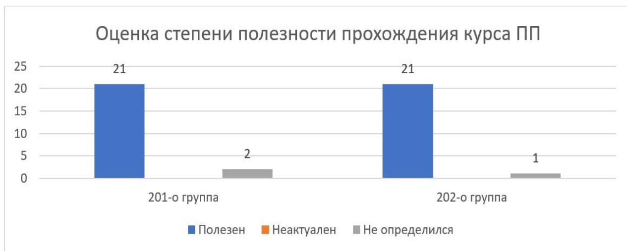
Рисунок 1 - Оценка студентами полезности прохождения ПП

В мае-июне 2022г была методическим руководителем ПП по ПМ. 02. Участие в лечебно-диагностическом и реабилитационном процессах (хирургия) специальности 34.02.01 Сестринское дело в 201-о и 202-о группах. Все студенты успешно прошли программу производственной практики и сдали дифференциальный зачет и после сдачи зачета прошли добровольное анонимное анкетирование по организации ПП. В анкетировании приняли участие все студенты, отказов не было. В 201-о группе участвовали 23 студента, в 202-о -22 студента. Всего 45 студентов (100%) прошли анкетирования. По результатам анкетирования сделаны следующие основные выводы.